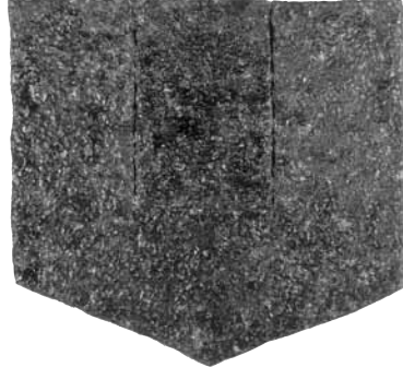
« Mijn huis », gesmolten graniet, 1965

« Een beeldhouwer van deze kwaliteit komt alleen eens in de vijfentwintig jaar uit! »